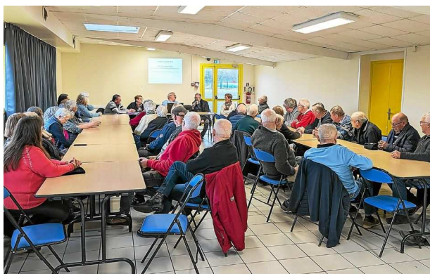
« Extrait du télégramme du 14 janvier »

Activité du club de la vallée : marche le mardi matin à 9 h, plaisir de chanter, le mardi à 14 h tous les quinze jours, dominos le jeudi à 13 h 45 et Pétanque le jeudi à 14 h.